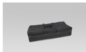
Inclui mala de transporte